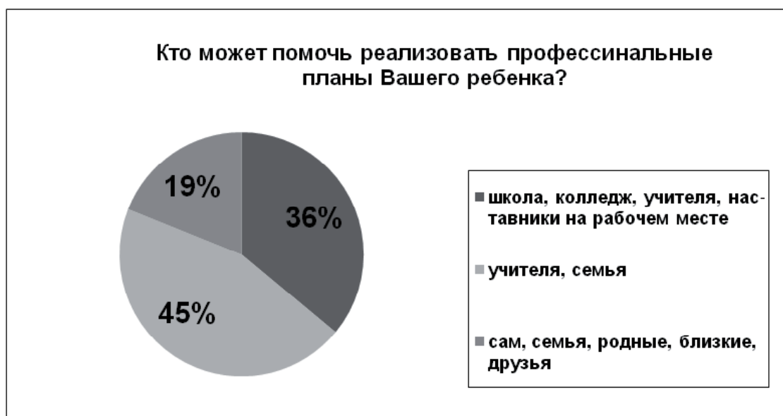
Рис. 5. Сформированность представлений родителей о возможностях реализации профессиональных планов их детей

8. На вопрос «Кто может помочь реализовать профессиональные планы вашего ребенка?» 81% ответили: «учителя, школа, колледж, наставники на рабочем месте», 19% – «сам, семья, родители, друзья» (рис. 5).