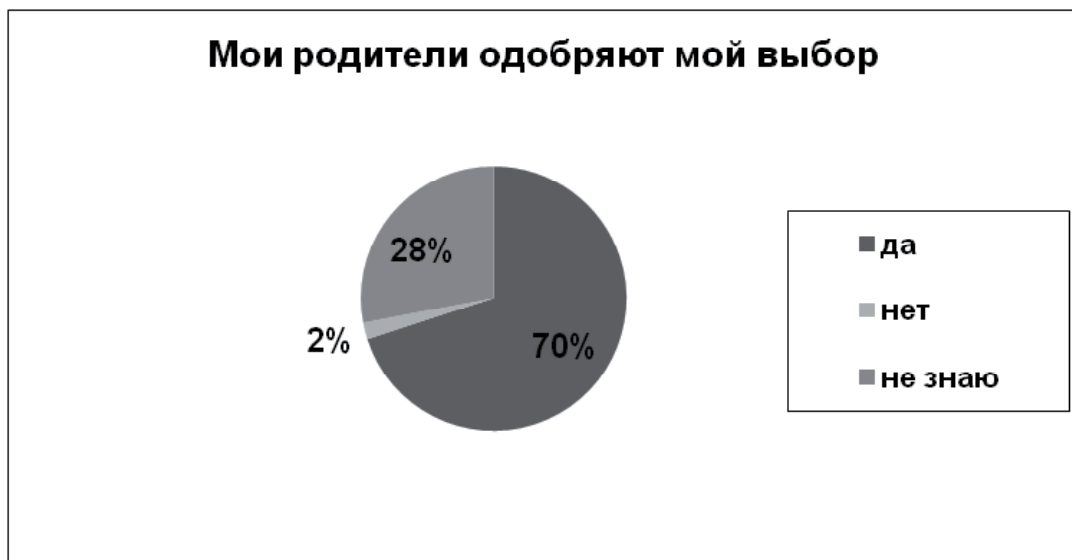
Рис. 2. Представление обучающихся и студентов о включенности родителей в сферу их профессиональных интересов

им оценить свои возможности для освоения профессии, проанализировать содержание профессии и дальнейшее трудоустройство, сделать в полной мере самостоятельный выбор.