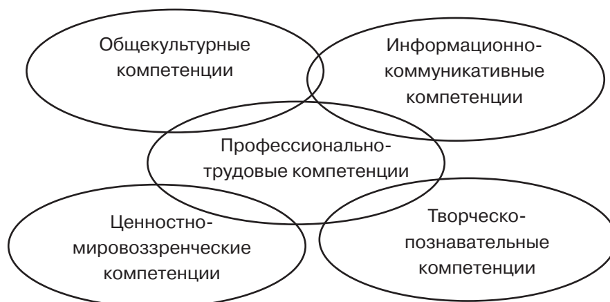
Рис. Модель «конгломерата» социальных компетенций на средней ступени общеобразовательной школы

На средней ступени общеобразовательной школы происходит смещение приоритетов в сторону акцентирования профессионально-трудового блока социальных компетенций, в то время как все остальные блоки (группы) компетенций конгломерируются вокруг него, и таким образом выстраивается некая модель «конгломерата» формируемых социальных компетенций учащихся средней школы (рис.).